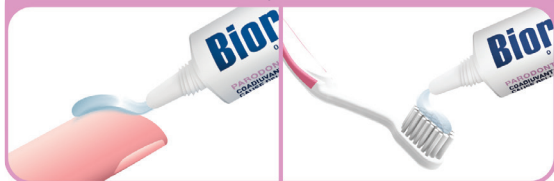
PANGE VÄIKE KOGUS GEELI SÕRMELE VÕI VÄGA PEHELE HAMBAAHARJALE JA HÕÖRUGE SEDA ÕRNALT IGEMETELE