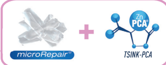
Antibakteriaalne ja hambakatu- vastane toime