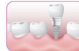
Patsientidele, kellel on periodontaalne haigus või implantaat