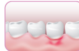
Tundlike igemete korral