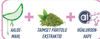
Rahustav ja niisutav toime

Kui kloorheksidiin on ainult antimikroobne aine, siis Biorepair® Parodontgel Intensive avaldab nii pehmetele kui ka kõvadele kudede mitmekülgset positiivset mõju: