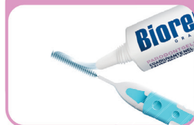
GEELI HAMBAAHARDESSE KANDMISEKS KANDKE SEDA HAMBAAHARJALE